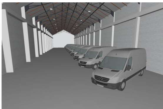
ZONES DE STOCKAGE