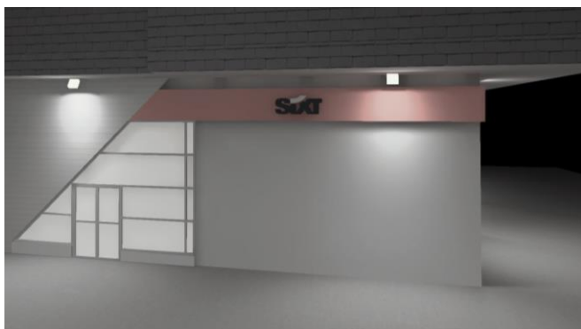
AGENCES DE LOCATION